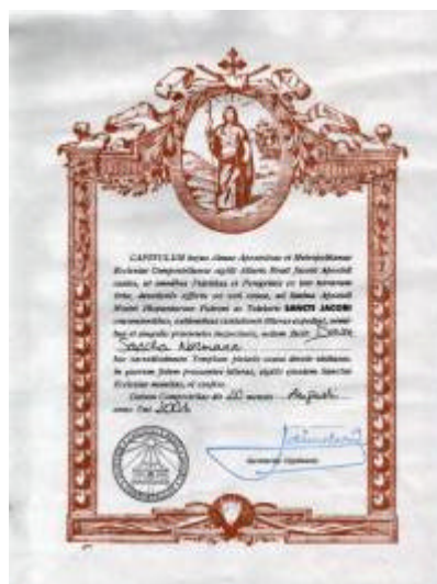
La Gran Compostela

Ich bin nur zufälligerweise auf diesen Weg gekommen und habe mich im Nachhinein geärgert, dass ich nicht schon früher davon gewusst habe. Wenn man den Weg geschafft hat, bekommt man die so genannte "Gran Compostela" - eine Urkunde die ausweist, dass man auf diesem Weg gepilgert und erfolgreich in Santiago angekommen ist. Diese