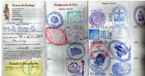
El Credencial del Peregrino

Urkunde, so wurde mir von vielen Spaniern versichert, ist etwas sehr wichtiges und angesehenes. Dass man sie deshalb gleich bei einer Bewerbung beilegen soll, glaube ich weniger... Das System verläuft folgendermaßen: Man lässt sich in seinen "Credencial del Peregrino" Stempel an verschiedenen Orten des Pilgerweges eintragen. Anhand dieses Ausweises kann man bei der Ankunft nachweisen, wie weit man gepilgert ist. Dies wird in der Urkunde aber nicht weiter vermerkt. Die Vorgaben sind: 100km für Fußgänger, 200km für Radfahrer bis nach Santiago.